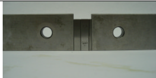
Meistermaß z.B. 415,568 mm fertig zum Abgreifen