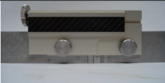
Spanner aufsetzen, Bolzen einsetzen, verspannen